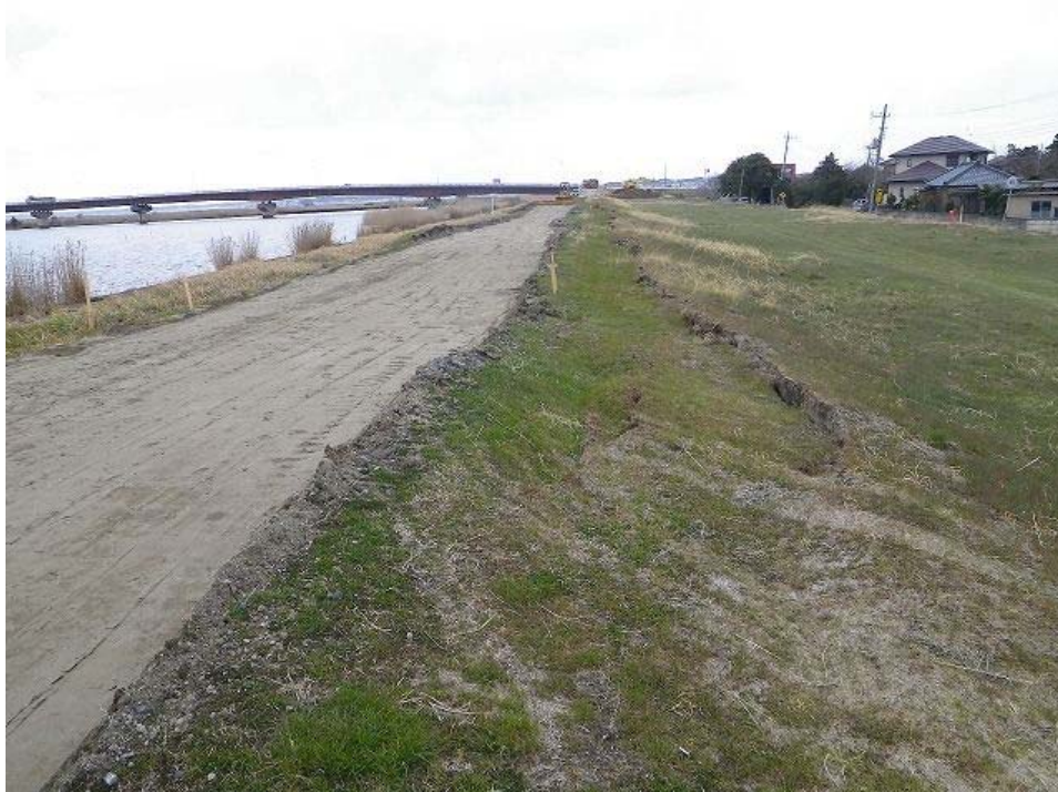
河川堤防の崩壊。一部側道にはらみ出している。復旧工事が進められていた。