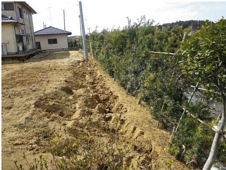
上の写真の住宅。液状化による地盤の沈下及び流動化。家屋の傾斜が肉眼で見られた。