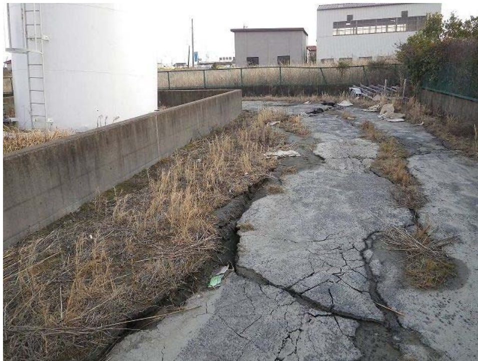
石油タンクの傾斜。周辺に噴砂。液状化による地盤沈下が原因か。