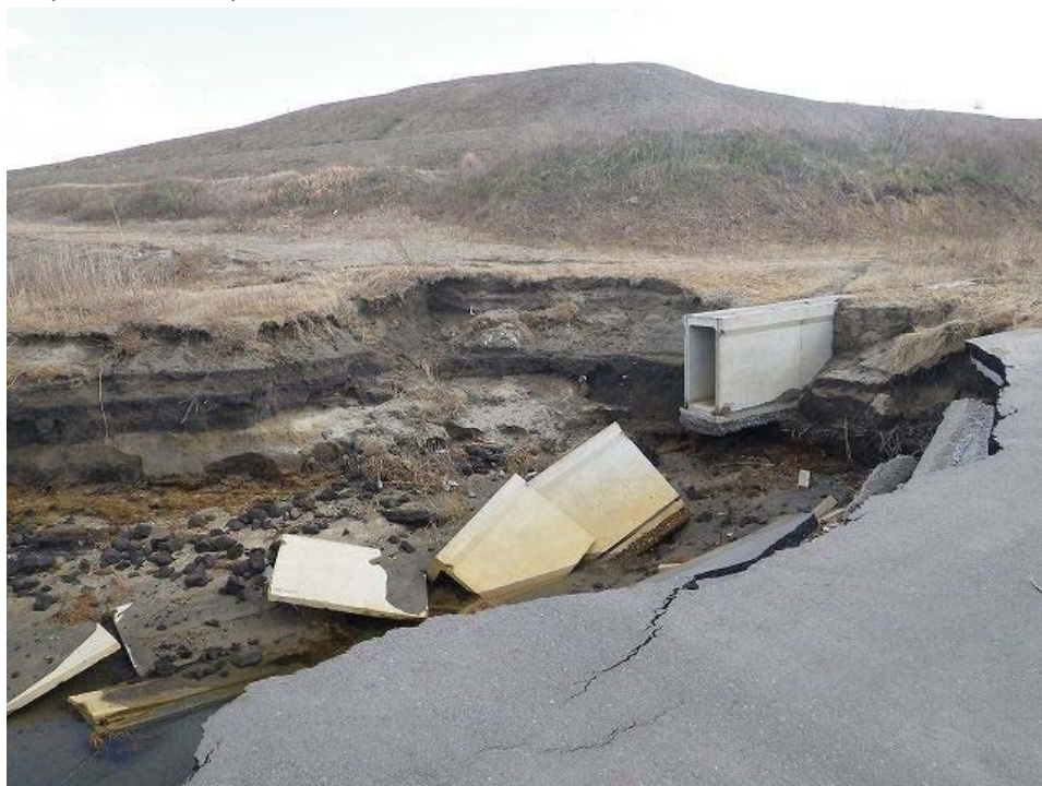
埠頭脇にある岸壁及び水路の崩壊。