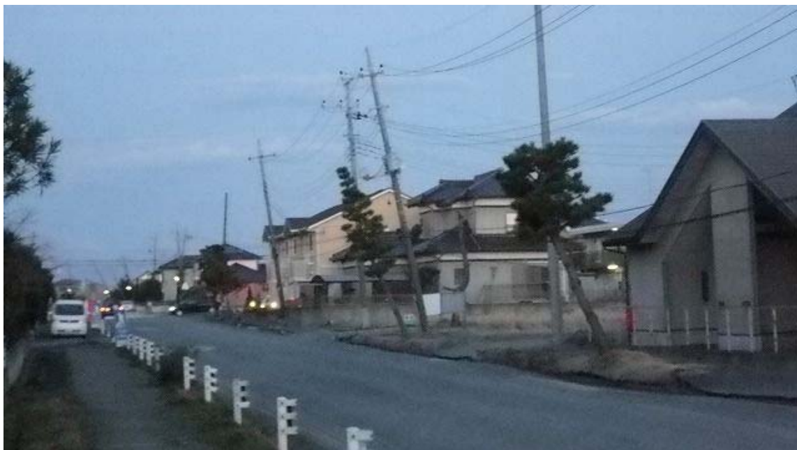
団地のほぼ全域で噴砂、電柱の傾斜が見られた。