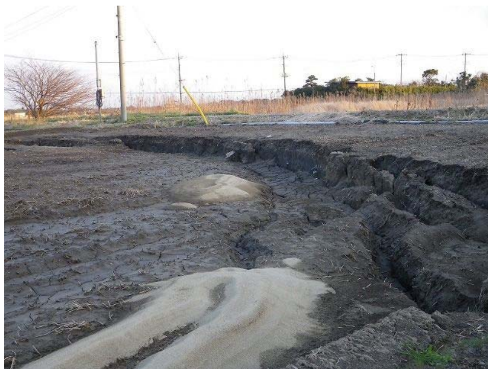
耕地のほぼ全面に噴砂、地盤沈下が見られた。