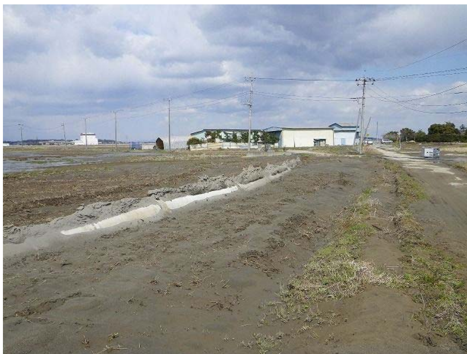
管路の浮き上がり。その近くでマンホールの浮き上がりも見られた。