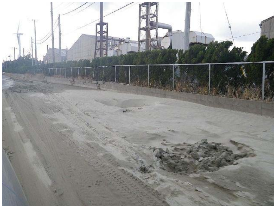
道路はほぼ噴砂で覆われている。