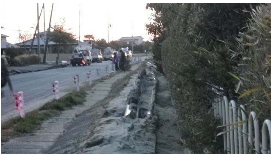
管路の浮き上がり。歩道を押しのけている。