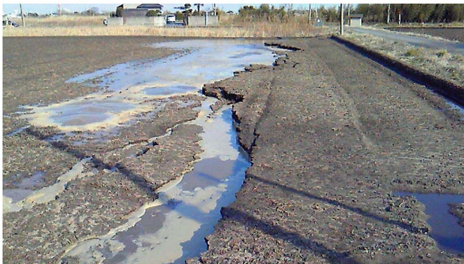
ほぼ上の写真の場所周辺で地震直後に当社技術者によって撮影されたもの。