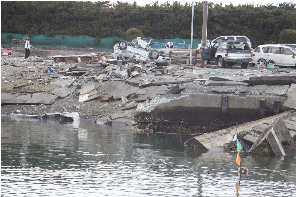
右に見える岸壁が崩壊、津波にさらわれたものと考えられる。