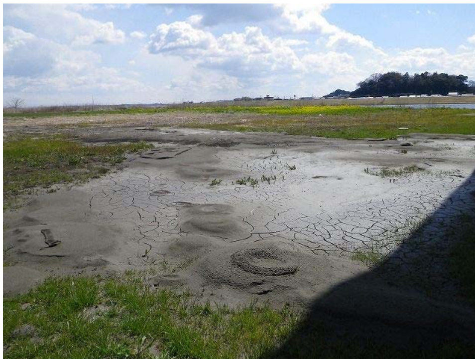
利根川河川敷（神崎大橋付近）。広範囲にわたって噴砂が見られた。