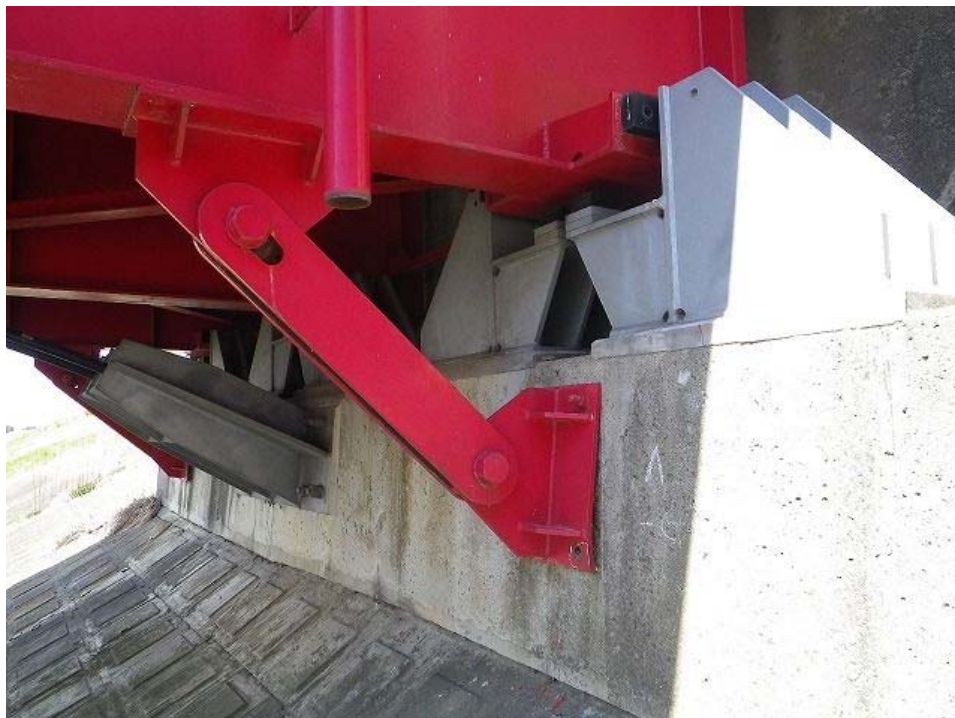
神崎大橋（昭和 42 年竣工）橋台。落橋防止装置のアンカーボルト欠落、可動支承及び伸縮装置も完全に移動しきっていた。対面橋脚のアンカーも同様に欠落していた。神崎大橋は通行止め。