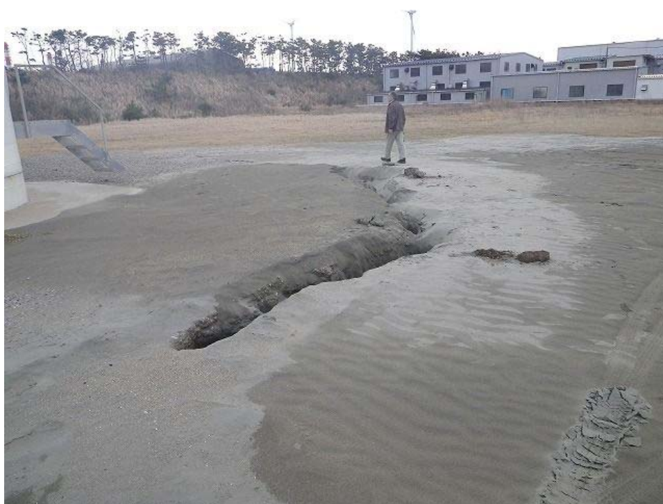
風力発電基部の噴砂。風車自体に傾斜等の変状は見られなかった。