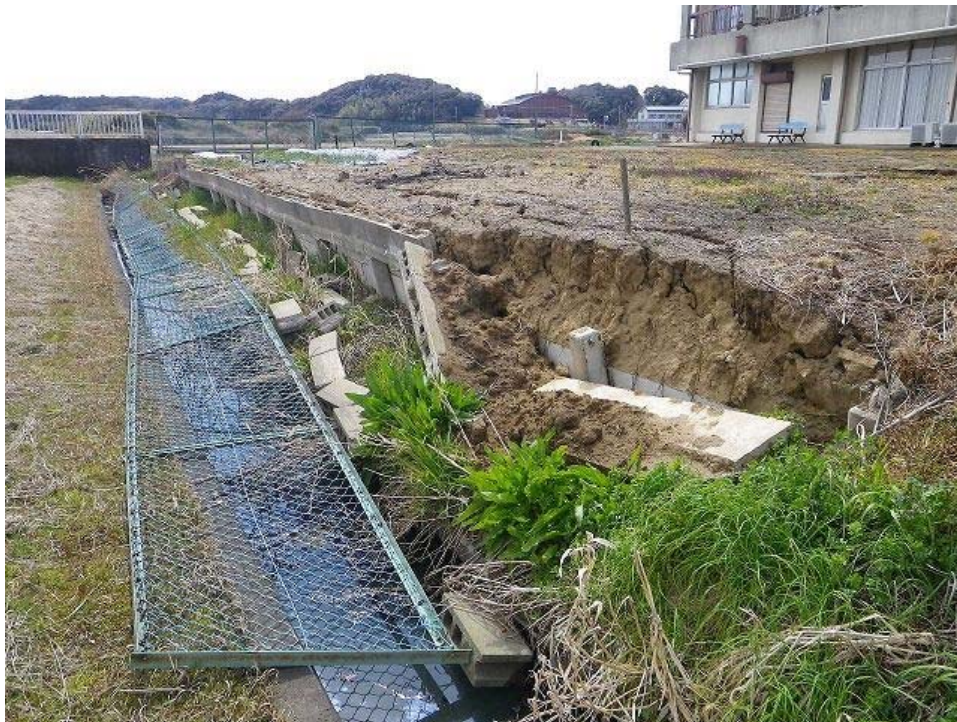
鹿行大橋西側に隣接する民宿。庭に線状の噴砂が見られ、地盤の流動化によってフェンス及びブロックが倒壊したと考えられる。