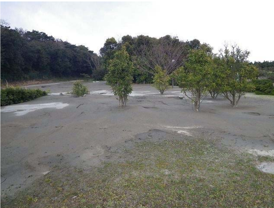
付近の公園で広範囲に噴砂。公園内の遊具及び樹木の撤去工事が行われていた（仮設住宅が建設される予定か？）