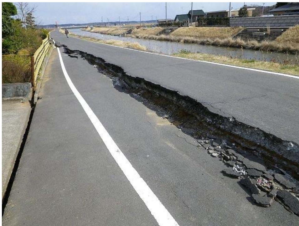
民家側の道路が沈下している。左に下の写真の住宅。その左は水路。