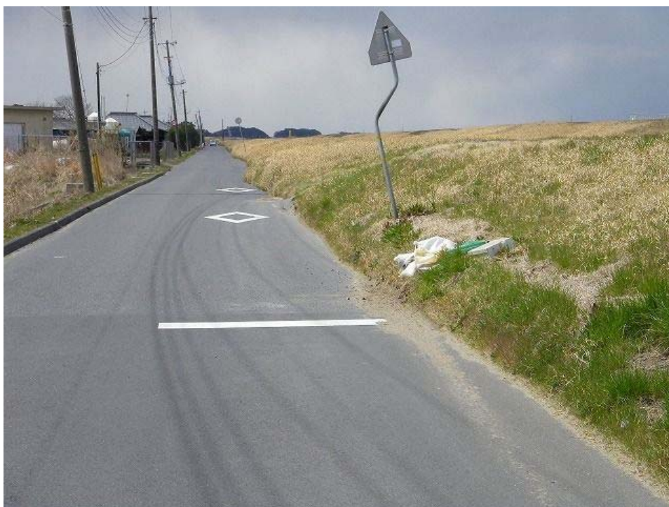
堤防の沈下、側道へのはらみ出しが見られた。