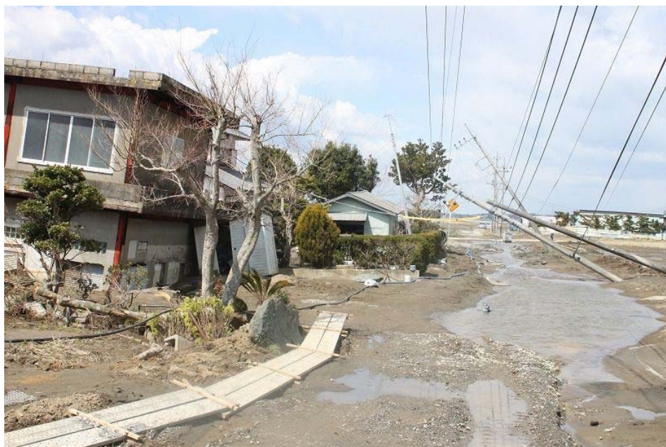
アスファルト舗装が完全に噴砂で覆われている。電柱、倉庫の沈下・傾斜。