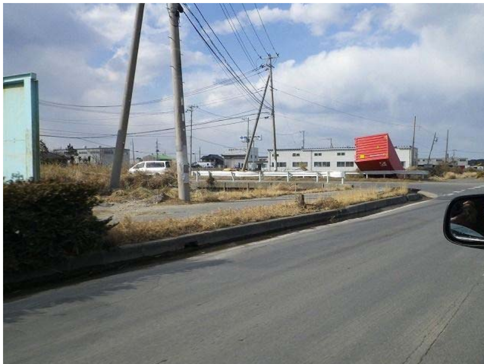
コンテナがガードレールの上に乗っていた。津波によって運ばれたものと考えられる。