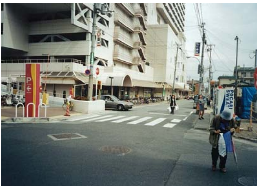
セルバ前の区画道路