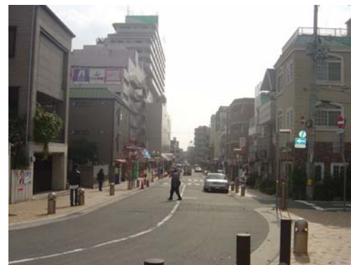
拡幅、修景整備された幹線道路 (森南線 13m)