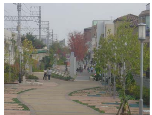
拡幅し修景整備された駅前広場 (新駅への出入口も新設)