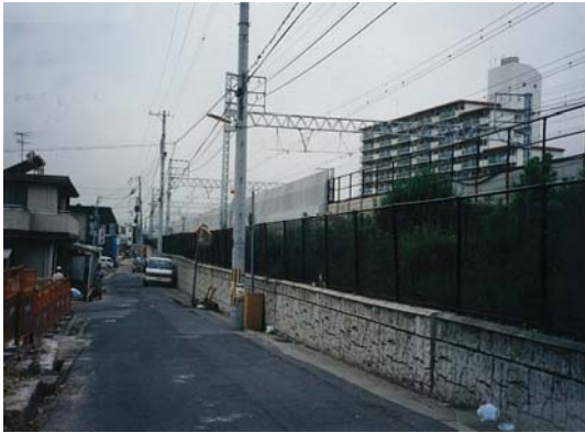
鉄道沿い区画道路