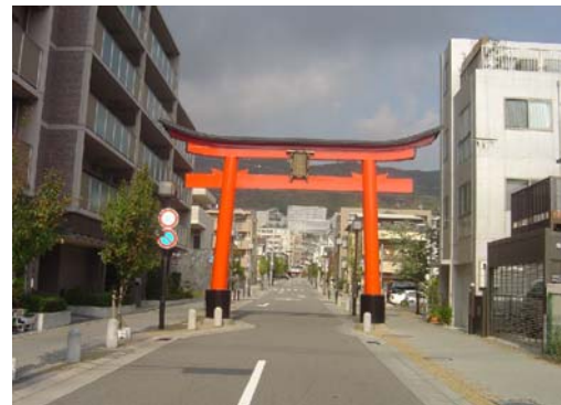
歩道拡幅、修景整備された幹線道路 (本庄本山線 13m)