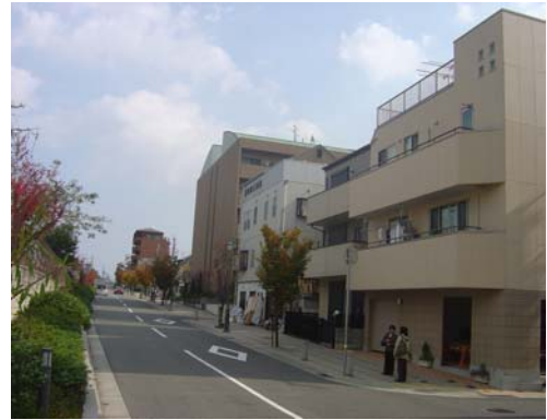
拡幅、修景整備され幹線道路 (森南東線 13m)