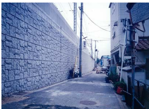
駅前広場計画地内の区画道路